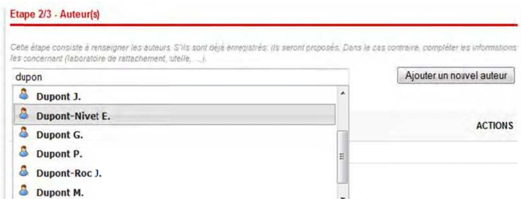
Exemple d'autocomplétion lors de la saisie des auteurs