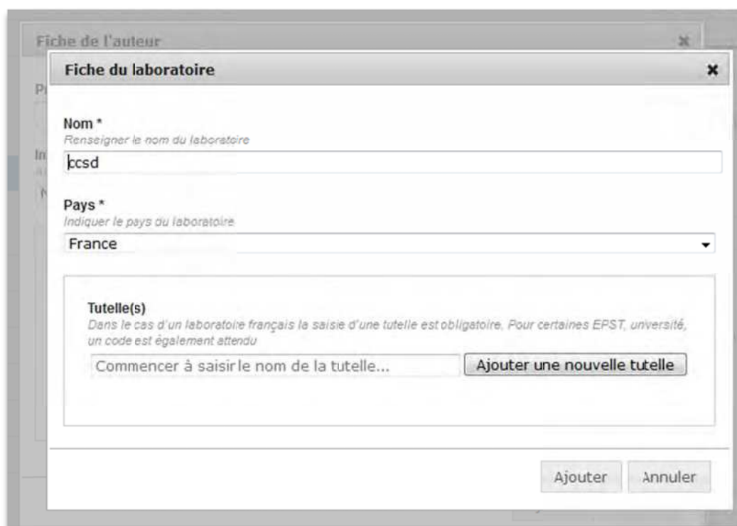
Fenêtre de renseignement des informations sur une affiliation

1/ Transfert des fichiers (étape facultative, définit par l'administrateur). Un champ vous permet de sélectionner un fichier sur votre poste de travail, cliquez ensuite sur « Transférer ». Préciser le fichier qui sera mis en avant lors de la consultation (fichier principal). Un fichier PDF est automatiquement créé si le fichier est transféré est dans un autre format.